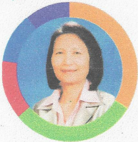
ศ.ดร.สุมาลี สังข์ศรี